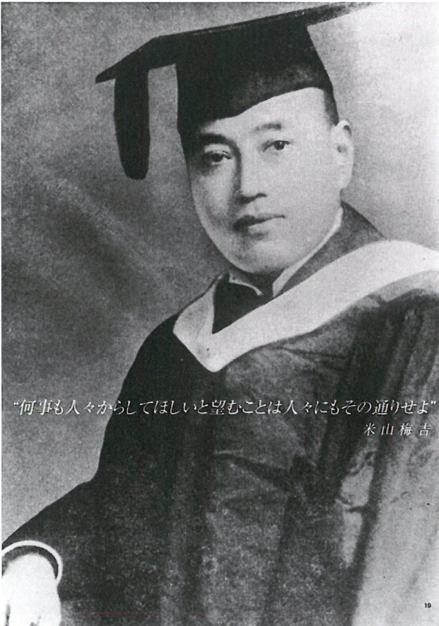
“何事も人々からしてほしいと望むことは人々にもその通りせよ” 米山梅吉