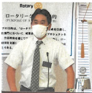
クラブ戦略委員会 危機管理委員会 委員長 毛野 位 会員